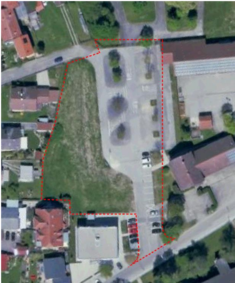
Luftbild vom Planungsgebiet

Im östlichen Bereich des Geltungsbereiches des neuen Bebauungsplanes befindet sich der ehemalige Verkehrsübungsplatz, der westliche Bereich war bisher Brachfläche.